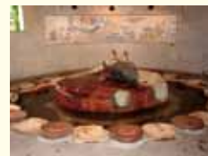
「やまと温泉やすらぎ館」でのご入浴。鶏ちゃんをはじめお土産をご購入できます。