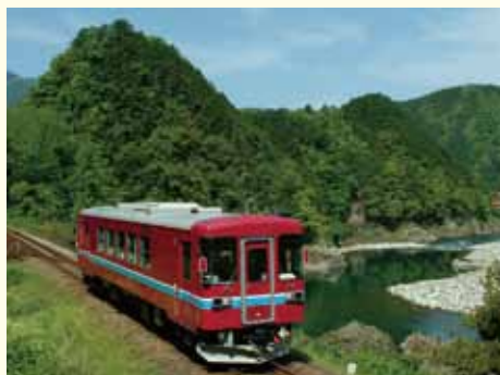
車両からの自然豊かな美しい景色をお楽しみください。